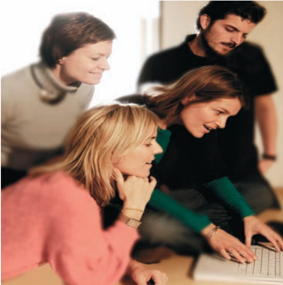
Feltet for socialt entreprenerskab