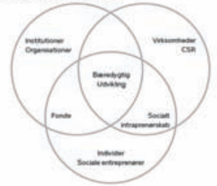
Kilde: Model udviklet af Johannes Meier og Christian Seif, ISE Business School

GODT/SKIDT ARBEJDSMILJØ – forskellen koster kassen. Dårligt arbejdsmiljø koster danske virksomheder 45 milliarder kroner om året, viser et notat for FTF, hovedorganisation for 450.000 offentligt og privat ansatte. - Fotos: Scanpix.